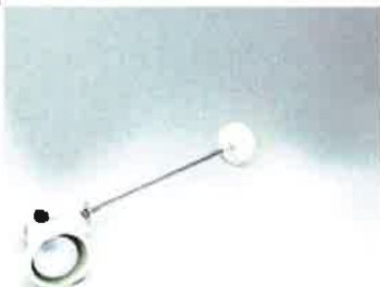
アームスポットライト (100W)