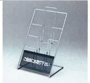
カタログスタンド (3 段)