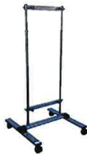
ユニバーサルスタンド W620×D600×H1255 (~H2000)