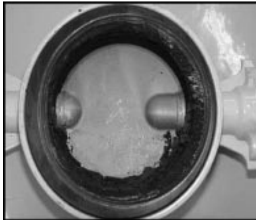
写真-1 バタフライバルブ