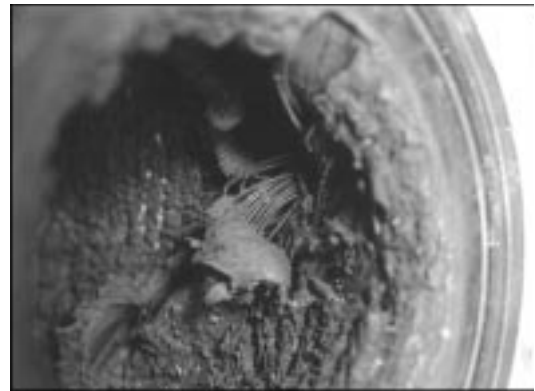
写真-3 球形ゴムフレキシ